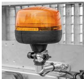
Rundumleuchte an der Rampe, optional