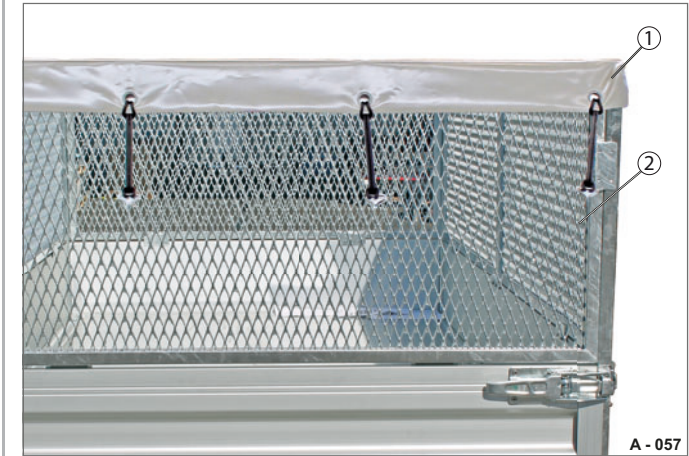
Abb. 64 Flachplane