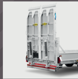
Einteilige, breite Rampen mit Stahlgitterrost