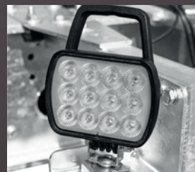
Zusätzlicher LED Arbeitscheinwerfer