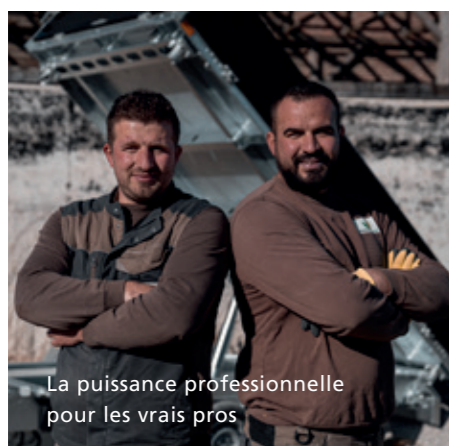
La puissance professionnelle pour les vrais pros