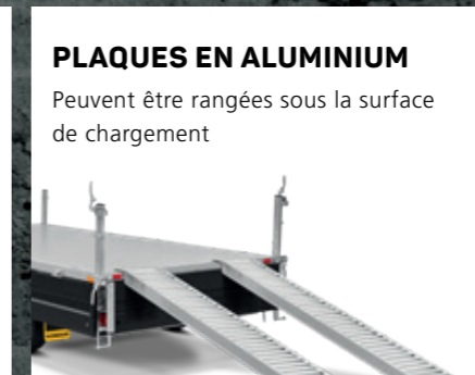
PLAQUES EN ALUMINIUM Peuvent être rangées sous la surface de chargement