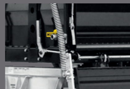
Fonctionnalité élaborée dans les moindres détails

Illustrations similaires, certaines d'entre elles montrent des équipements différents ou spéciaux.