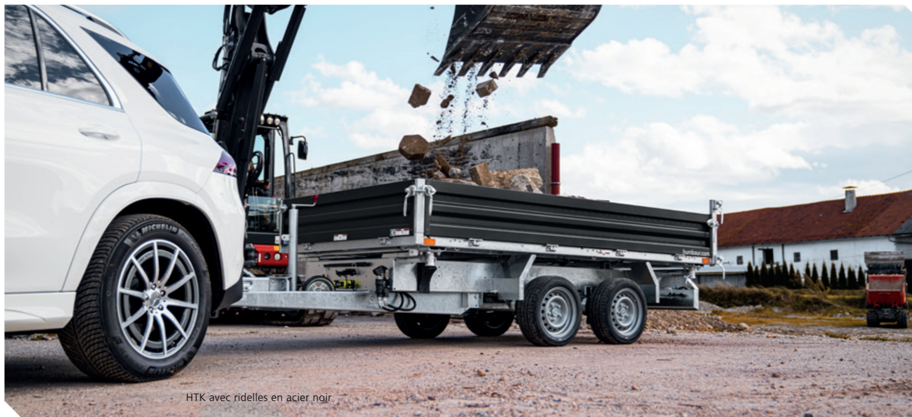
HTK avec ridelles en acier noir