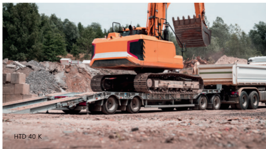
HTD 40 K

Le revendeur le plus proche de chez vous s'occupe de vous et de votre remorque jusqu'à 3,5 t. Les propriétaires de remorques à partir d'un poids total de 5 t peuvent faire appel à notre service direct. Si vous avez besoin d'une pièce de rechange ou si vous avez une question concernant l'utilisation de votre remorque, nous sommes là pour vous assister en compagnie de votre revendeur. Des prestations et services supplémentaires sont disponibles pour de nombreux produits du secteur des charges lourdes !