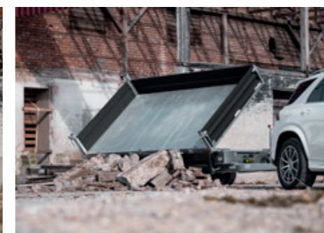
La HTK peut basculer en arrière et sur le côté en un tournemain.