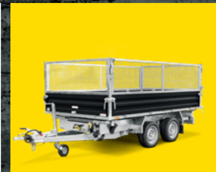
REHAUSSE GRILLAGÉE EN ACIER Parfaite pour l'aménagement paysager et le jardin