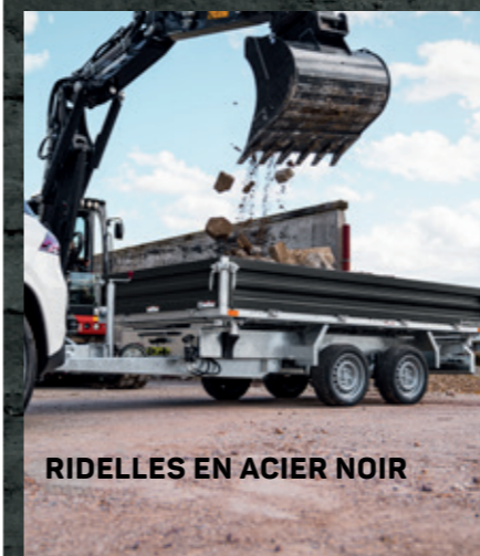
RIDELLES EN ACIER NOIR