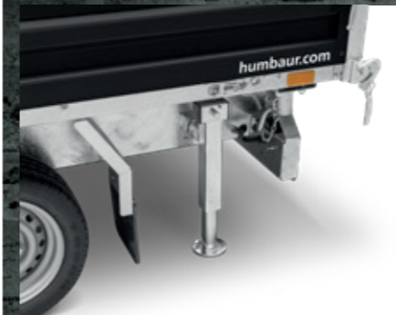
SUPPORTS TÉLESCOPIQUES À MANIVELLE Stabilité optimale, rabattable