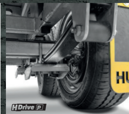
RESSORT PARABOLIQUE Faible débattement, confort maximal