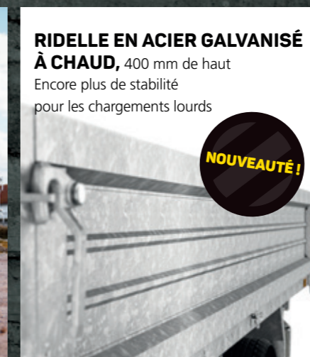
RIDELLE EN ACIER GALVANISÉ À CHAUD , 400 mm de haut Encore plus de stabilité pour les chargements lourds