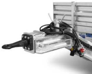
Schwenkzugöse 40/50 mm, optional