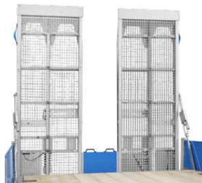
Verzinkte Stahl-Auffahrampen mit optionalem Gitterrostbelag