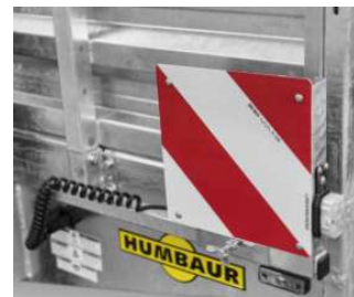
Ausziehbare Warntafeln, optional