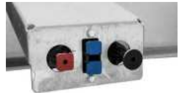
Bremssystem mit Federspeicher-Feststellbremse