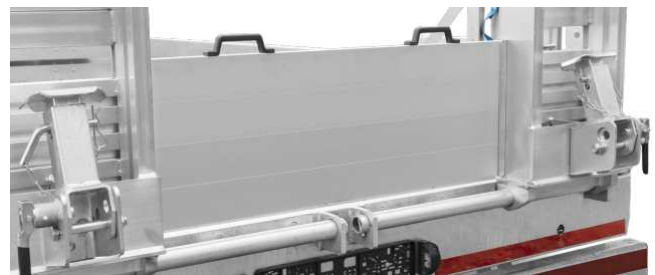
Seitlich verschiebbare Rampen, optionale Steckwand