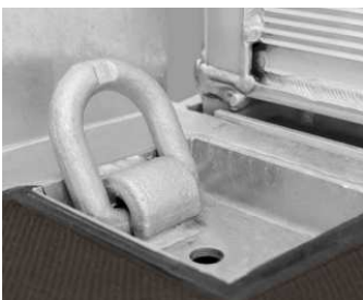
Zurrpunkte im Brückenboden versenkt