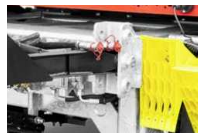
3 Lagerpositionen für die Zugdeichsel

*Sicherheitshinweis! Die Verwendung der Anhänger darf nur unter ausdrücklicher Beachtung aller straßenverkehrsrechtlichen, berufsgenossenschaftlichen und ladungssicherungstechnischen Vorschriften erfolgen. Alle Angaben ohne Gewähr! Für Irrtümer und Druckfehler wird keine Haftung übernommen. Technische Änderungen vorbehalten. Alle Maßangaben sind ca. Werte und beziehen sich auf das Serienfahrzeug ohne Zubehör. Zusatzausstattung verändert das Eigengewicht und die Nutzlast. Abbildungen ähnlich, können aufpreispflichtiges Zubehör enthalten.