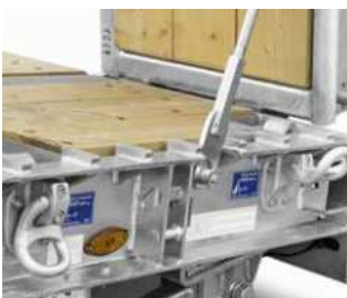
Kletterleisten am Außenrahmen im Bereich der Auffahrtsschräge