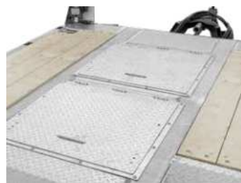
2 versenkte Werkzeugkästen mit Deckel